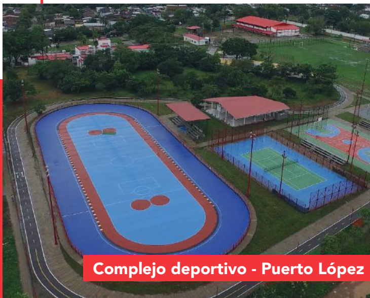
Complejo deportivo - Puerto López