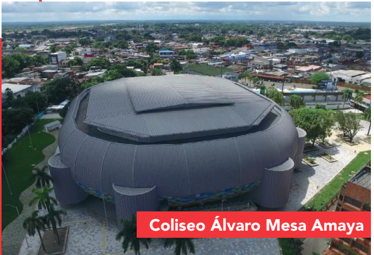
Coliseo Álvaro Mesa Amaya