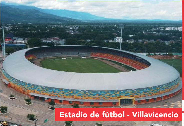
Estadio de fútbol - Villavicencio