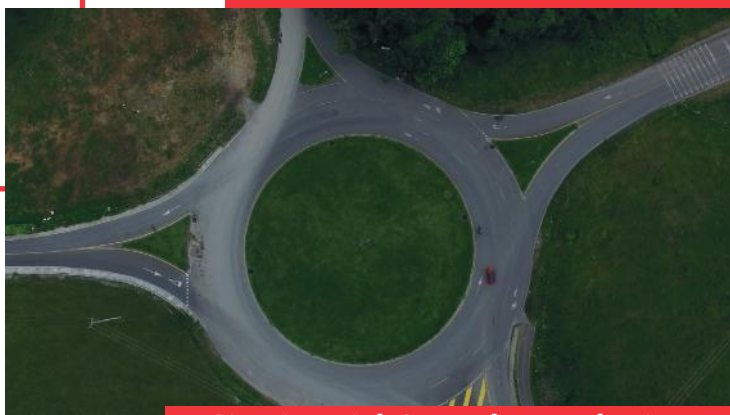
Circuito vial Corredor Ecológico - veredas Las Mercedes y Barcelona