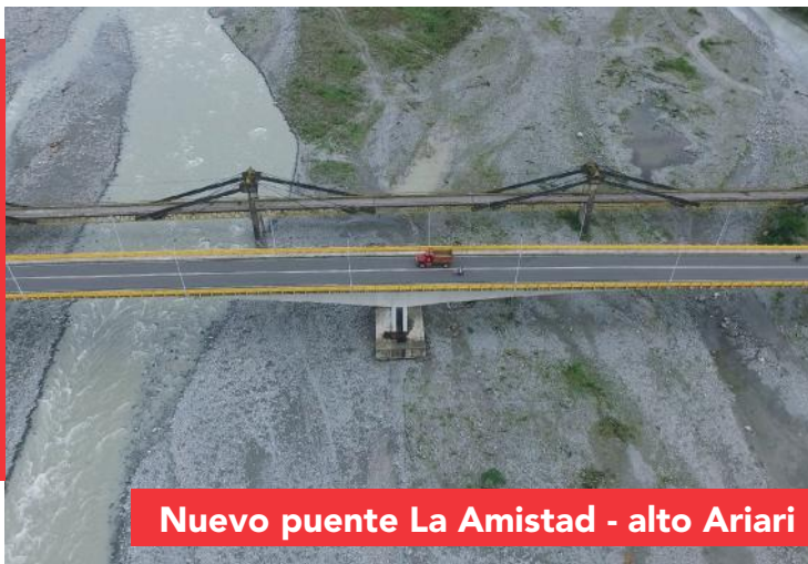
Nuevo puente La Amistad - alto Ariari

El proyecto más importante que ejecutó el gobierno de Marcela Amaya fue el moderno plan vial que intervino miles de kilómetros con puentes, dobles calzadas, mejoramientos, pavimentaciones y placas huellas en cada una de las subregiones del Meta, para reinventar la economía local con turismo y la recuperación del agro , tras la implementación de los acuerdos de paz y el cambio desfavorable para el departamento en la renovada ley de regalías.