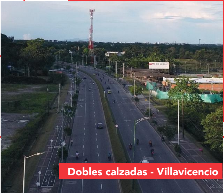
Dobles calzadas - Villavicencio