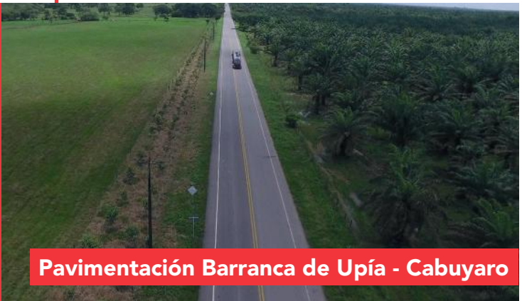
Pavimentación Barranca de Upía - Cabuyaro